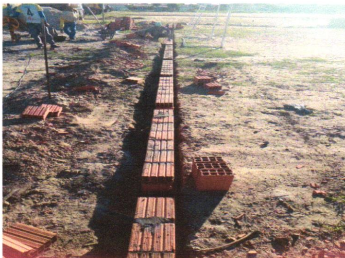
Foto 02 - ALVENARIA DE VEDAÇÃO DE BLOCOS CERÂMICOS FURADOS NA VERTICAL DE 9X19X39 CM (ESPESSURA 9 CM) E ARGAMASSA DE ASSENTAMENTO COM PREPARO EM BETONEIRA. AF_12/2021

Evaldo Almeida Moraes Engenheiro Civil RNP 051417303-3