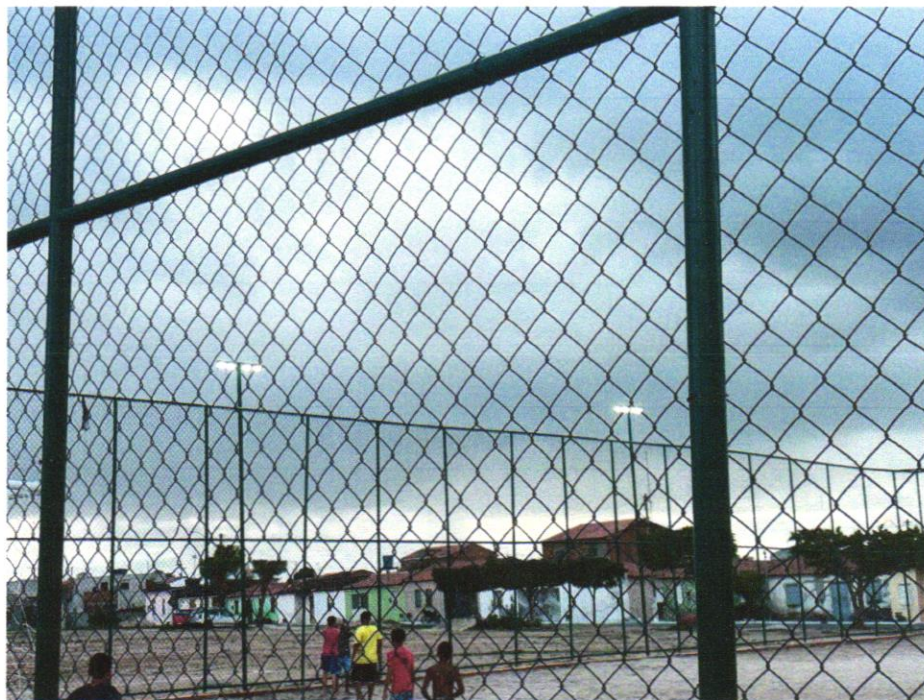
Foto 07 - Refletor Slim LED 200W de potência, branco Frio, 6500k, Autovolt, marca G-light ou simila