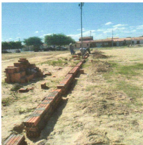
Foto 01 – ALVENARIA DE VEDAÇÃO DE BLOCOS CERÂMICOS FURADOS NA VERTICAL DE 9X19X39 CM (ESPESSURA 9 CM) E ARGAMASSA DE ASSENTAMENTO COM PREPARO EM BETONEIRA. AF_12/2021