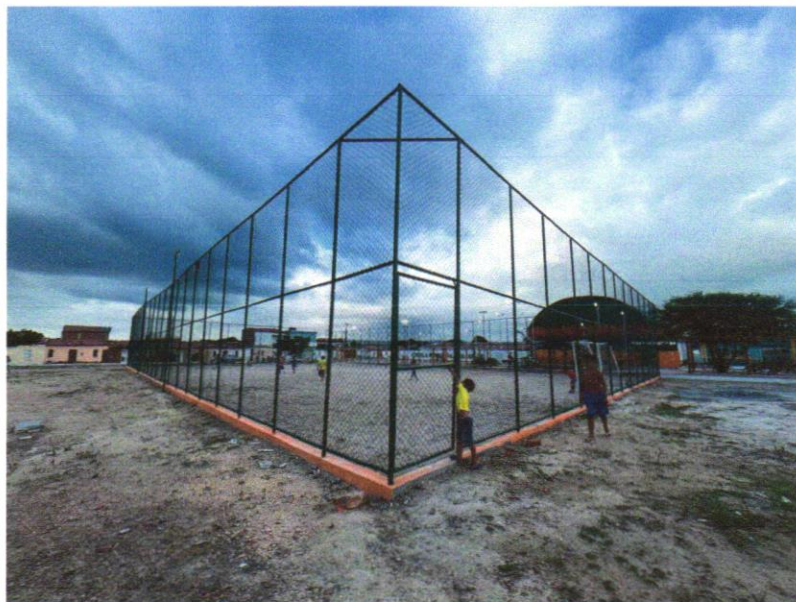
Foto 05 - ALAMBRADO PARA QUADRA POLIESPORTIVA, ESTRUTURADO POR TUBOS DE AÇO GALVANIZADO, (MONTANTES COM DIÂMETRO 2", TRAVESSAS E ESCORAS COM DIÂMETRO 1 ¼ ), COM TELA DE ARAME GALVANIZADO, FIO 10 BWG E MALHA QUADRADA 5X5CM (EXCETO MURETA). AF_03/2021